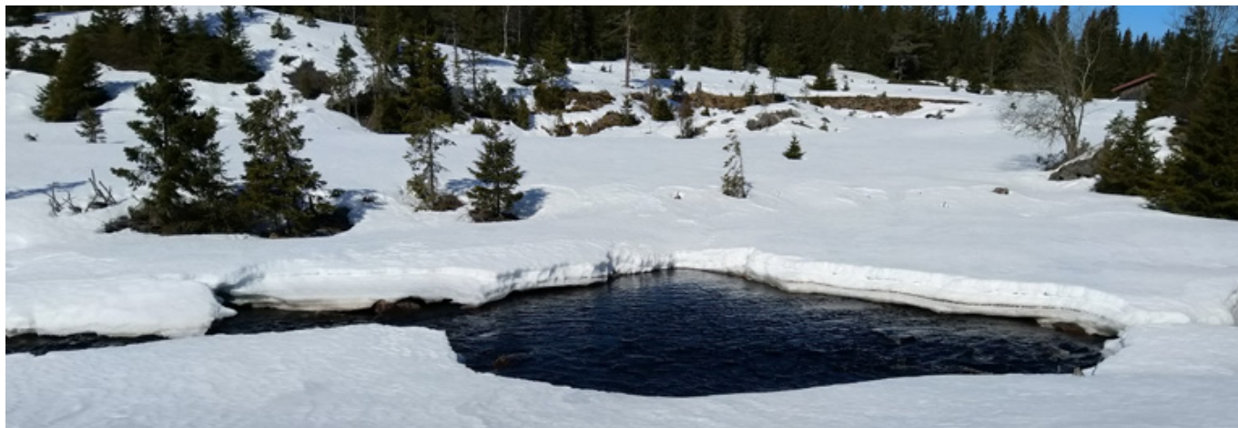
Flagstadelva ved Tørrbustilen