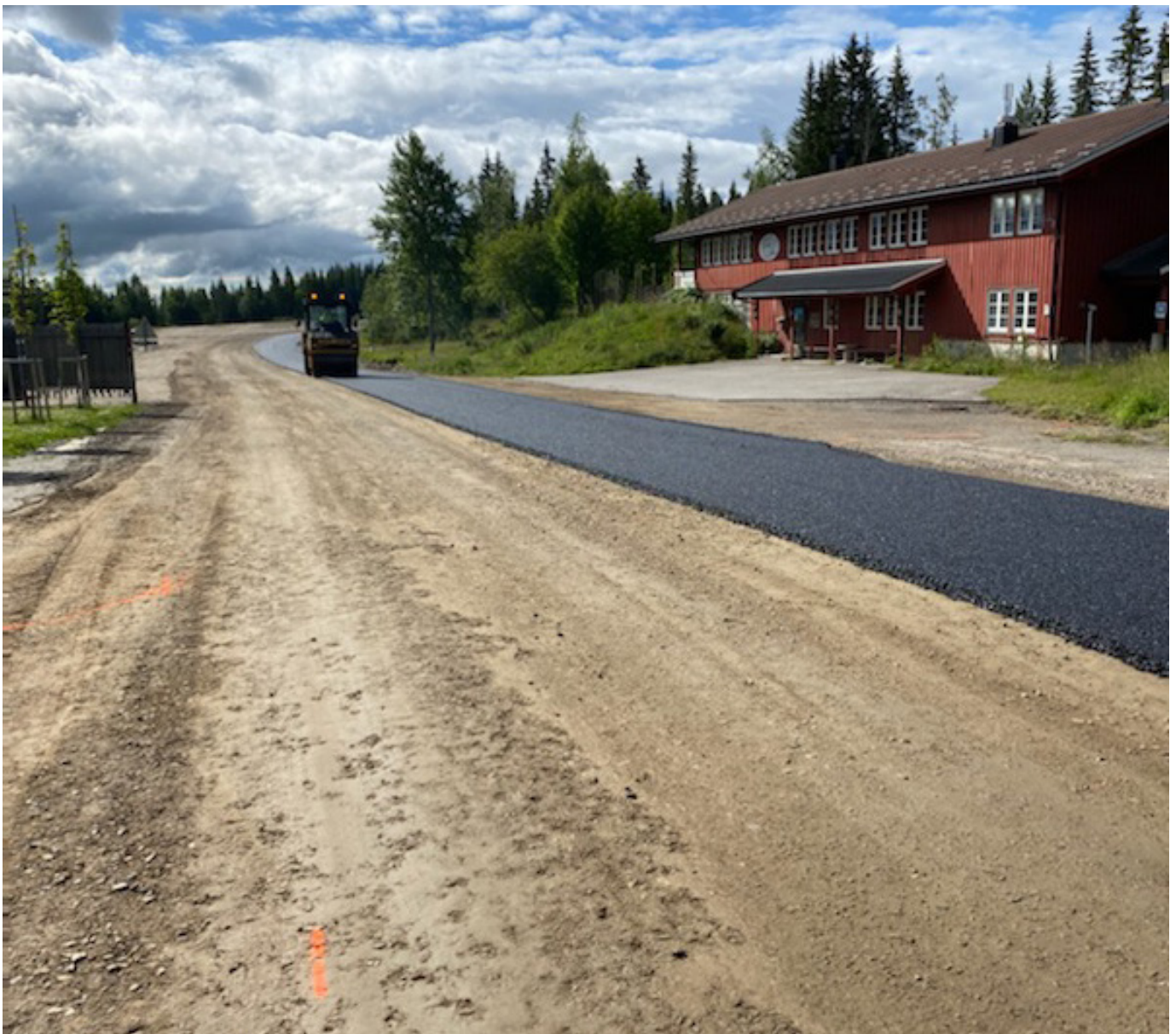
Asfaltering ved Gåsbu parkering.

Fjelltaket er avgjørende for vedlikehold og oppgradering av vegnettet i allmenningen. I tillegg til salg av fjellmasser for kr 1,6 mill utgjør kostnadsbesparelse på allmenningens vegprosjekter kr 4 mill på grunn av gunstig innkjøp og kort frakt.