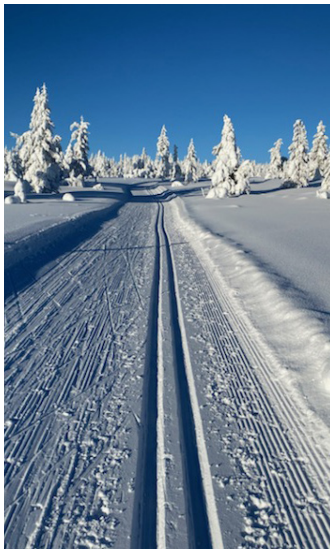
Skiløypa Bårdsætra – Appelsinhaugen.

Vang Almenning har videreført det gode samarbeidet med Hamar og Hedmarken Turistforening. Samarbeidet er formalisert gjennom en samarbeidsavtale som blant annet omfatter de to koiene Sandfløten og Hallgutusveen.