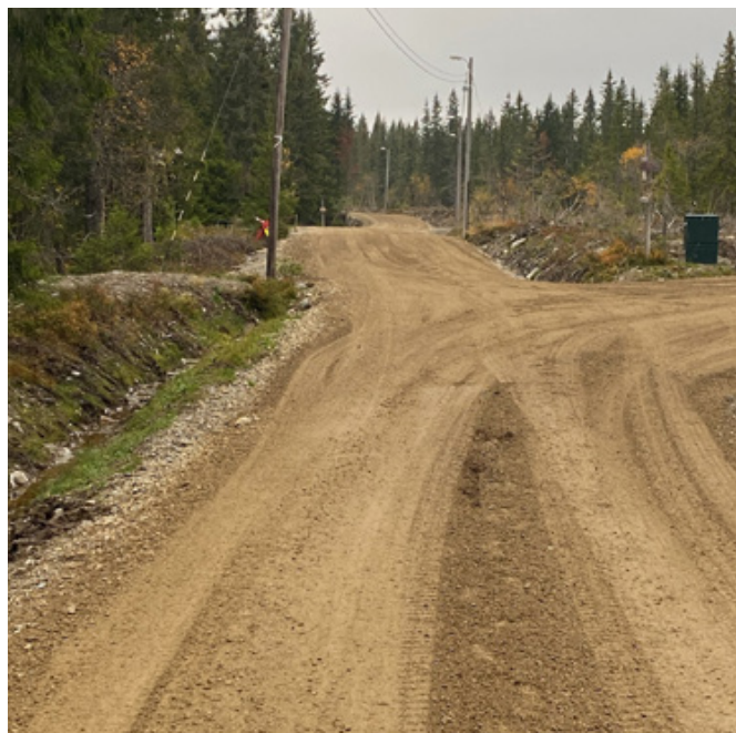
Bildet viser opprusting av Lageråkvislavegen, en flerbruksveg som blir brukt til skiløype om vinteren, hytte, turveg og driftsveg for allmenningen om sommeren.

Kostnader vintervedlikehold kr. 1 869 966.