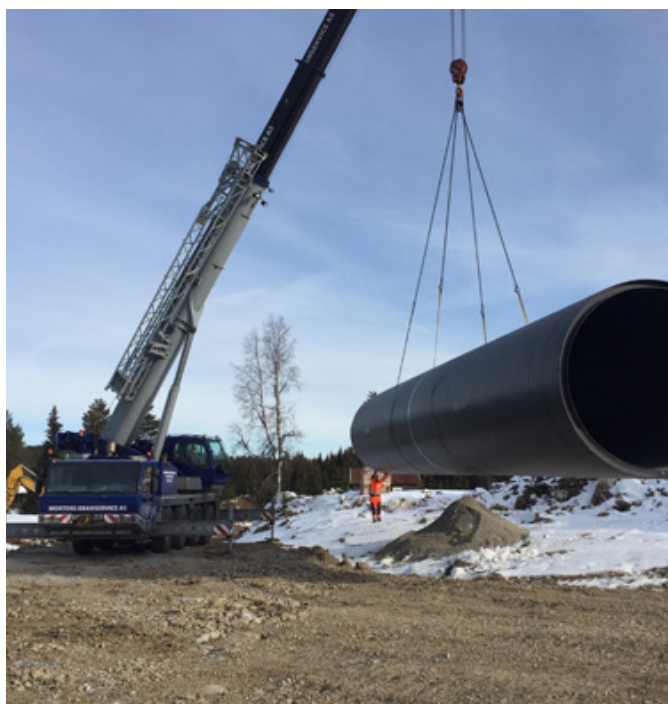
Rør som erstatter bru over Grønholtbekken på Nysætra.