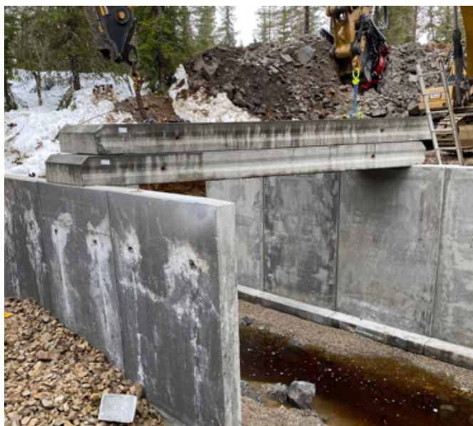
Oppgradering av veger og bruer er prioritert i allmenningen.